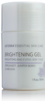
AUFHELLENDES GEL 30 ml

dōTERRA Straffendes Serum mit den ätherischen CPTG™-Ölen Frankincense (Weihrauch), Hawaiian Sandalwood (Hawaiianisches Sandelholz) und Myrrh (Myrrhe) wurde wissenschaftlich so formuliert, dass es das Erscheinungsbild von feinen Linien und Fältchen reduziert und die Haut gut mit Feuchtigkeit versorgt. Eine Kombination aus natürlichen Extrakten und Gummi sorgt mit wirksamen Inhaltsstoffen für eine straffere, jünger aussehende Haut.