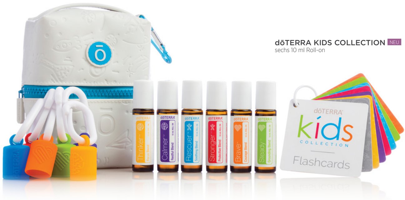
dōTERRA KIDS COLLECTION NEU sechs 10 ml Roll-on

Ganz gleich ob erfahrener Anwender oder Anfänger mit ätherischen Ölen – die dōTERRA Kids Collection ist eine komplette und fertige „Ganzkörper“-Toolbox für ätherische Öle, die entwickelt wurde, um die Gesundheit und das Wohlbefinden unserer Kleinen auf sichere Weise zu schützen. Diese ätherischen Ölmischungen wurden gezielt für die Entwicklung von Geist, Körper und Emotionen entwickelt und zeichnen sich durch einzigartige Kombinationen aus, die kraftvolle Vorteile bieten und gleichzeitig sanft zu empfindlicher Haut sind.