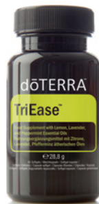
TRIEASE™ SOFTGELS 60 pflanzliche Softgels

TriEase Softgels wurden für ein gesünderes Ich entwickelt und werden sowohl von langjährigen als auch von neuen Anwendern ätherischer Öle verwendet. Jedes Softgel enthält zu gleichen Teilen die ätherischen Öle Zitrone, Lavendel und Pfefferminze. Mit den speziell entwickelten TriEase Softgels können nun alle drei wohltuenden ätherischen Öle auf Reisen oder bei Veranstaltungen im Freien schnell und einfach eingenommen werden. TriEase Softgels können täglich eingenommen werden.