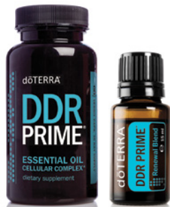
DDR PRIME™ 15 ml

DDR Prime kombiniert die Vorteile der ätherischen Öle Clove (Gewürznelke), Thyme (Thymian) und Wild Orange (Wildorange), die für ihre antioxidativen Eigenschaften bekannt sind. Die Mischung wurde entwickelt, um den Körper und die Zellen vor oxidativem Stress zu schützen.