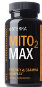
MITO2MAX™ ENERGIE & AUSDAUER KOMPLEX 60 pflanzliche Softgels

Mito2Max ist eine geschützte Formel aus standardisierten Pflanzenextrakten und Stoffwechsel-Cofaktoren, die Sie in Ihrem turbulenten Alltag unterstützen. Als Langzeitalternative zu koffeinhaltigen Getränken und Nahrungsergänzungsmitteln.