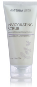
BELEBENDES PEELING 70 g

dōTERRA Gesichtsreiniger enthält die ätherischen CPTG™-Öle von Melaleuca (Teebaum) und Peppermint (Pfefferminze), die für ihre Fähigkeit bekannt sind, die Haut zu reinigen und zu straffen und einen gesunden Teint zu unterstützen. Die natürlichen Reiniger aus Extrakten von Yuccawurzel und Seifenrindenbaum befreien sanft von Unreinheiten und lassen die Haut sauber, frisch und glatt aussehen.