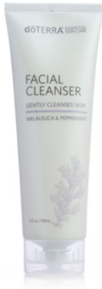
GESICHTSREINIGER 18 ml

dōTERRA Gesichtsreiniger enthält die ätherischen CPTG™-Öle von Melaleuca (Teebaum) und Peppermint (Pfefferminze), die für ihre Fähigkeit bekannt sind, die Haut zu reinigen und zu straffen und einen gesunden Teint zu unterstützen. Die natürlichen Reiniger aus Extrakten von Yuccawurzel und Seifenrindenbaum befreien sanft von Unreinheiten und lassen die Haut sauber, frisch und glatt aussehen.