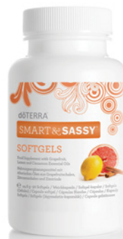
SMART & SASSY™ SOFTGELS 90 pflanzliche Softgels

Smart & Sassy Softgels enthalten die geschützte Smart & Sassy ätherische Ölmischung in praktischen Kapseln zur Unterstützung Ihrer Gewichtskontrolle. Die schmackhafte Mischung von Smart & Sassy enthält ätherische Öle, die einen gesunden Lebenswandel und eine positive Stimmung fördern.